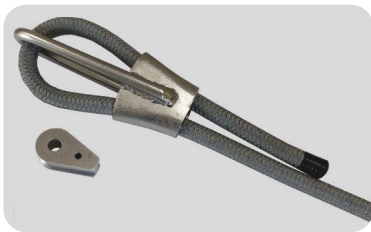
Konfektionierung der torsionsarmen Leine mit einem Keilschloss.