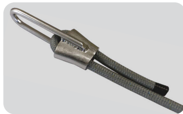
Der Überstand von ca. 20 cm wird mit einem Takling gesichert (und mit einem Schrumpfschlauch überzogen)